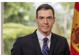
Pedro Sánchez Pérez-Castejón 2018-