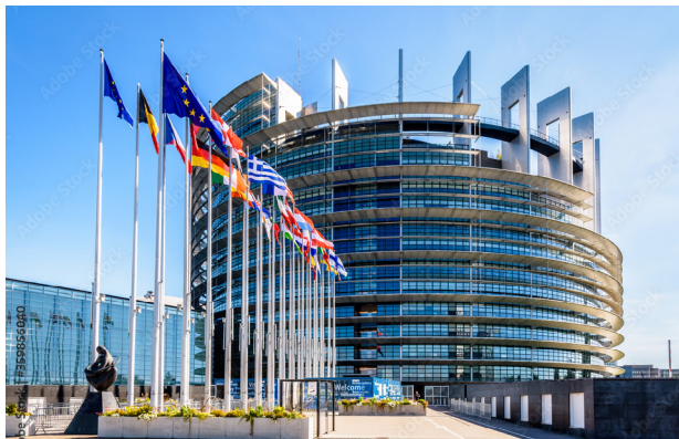
Parlamento Europeo (Edificio Louise Weiss). Estrasburgo, Francia.

El Consejo de la Unión Europea, representa a los gobiernos de cada uno de los Estados miembros. Está compuesto por un representante de cada Estado miembro con rango ministerial. La Presidencia del Consejo de la UE tiene carácter rotatorio y su duración es de seis meses. El Consejo tiene funciones legislativas y presupuestarias. Adopta la legislación de la Unión mediante reglamentos y directivas a partir de las propuestas de la Comisión. Además, aprueba junto a la Eurocámara el presupuesto.