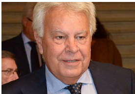
Felipe González 1976-1982