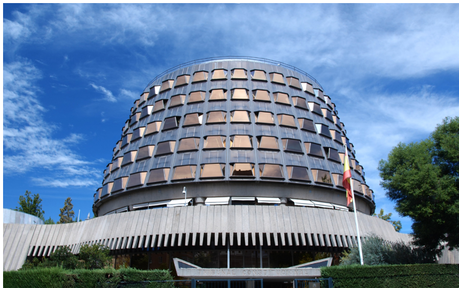
Tribunal Constitucional, Madrid.

El Tribunal Constitucional , es un órgano jurisdiccional separado de los tribunales ordinarios y del Consejo General del Poder Judicial. No forma parte del poder judicial. Desempeña tareas relacionadas con la interpretación y aplicación de la Constitución de la que es el intérprete supremo. Se compone de 12 miembros y sus funciones son el control de la constitucionalidad de las leyes, la protección de los derechos fundamentales y la resolución de conflictos que enfrenten a las altas instituciones.