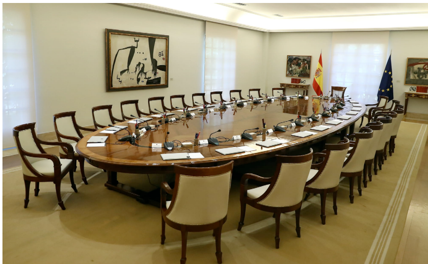
Consejo de Ministros, Madrid.

El Gobierno dirige la política interior y exterior , el conjunto de la Administración civil y militar y la defensa del Estado. También pone en marcha políticas públicas ejecutando las normas aprobadas por las Cortes Generales y desarrollándolas mediante reglamentos.