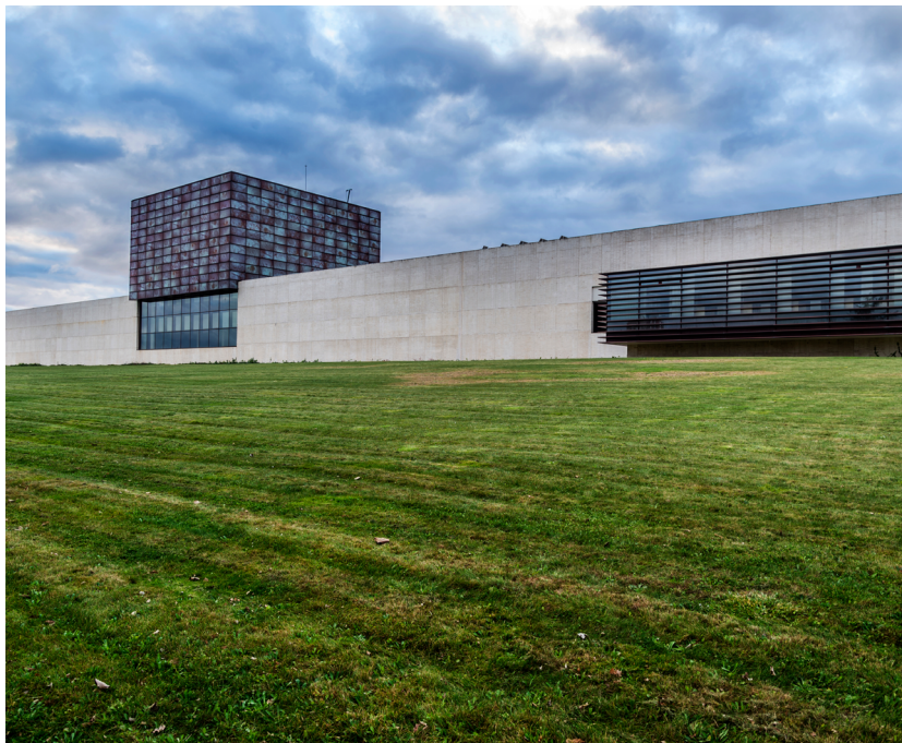
Cortes de Castilla y León, Valladolid.

La CCAA de Castilla y León está conformada por nueve provincias: Ávila, Burgos, León, Palencia, Salamanca, Segovia, Soria, Valladolid y Zamora. El Estatuto de Autonomía de Castilla y León, aprobado en 1983 y reformado en 2007, establece la composición y funcionamiento de sus instituciones autonómicas.