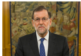
Mariano Rajoy 2011-2018