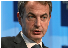
José Luis Rodríguez Zapatero 2004-2011