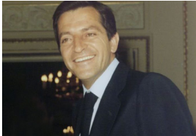
Adolfo Suárez 1976-1982