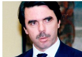
José María Aznar 1976-1982