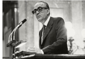
Leopoldo Calvo Sotelo 1976-1982