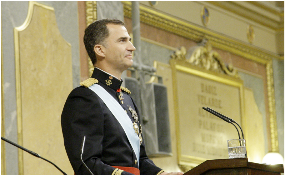
Proclamación del Rey Felipe VI en 2014.

La Corona es un cargo hereditario que se transmite siguiendo la línea de sucesión dinástica. Para establecer el orden de sucesión, los hijos varones tienen prioridad sobre las mujeres y los hijos primogénitos tienen prioridad sobre los de menor edad.