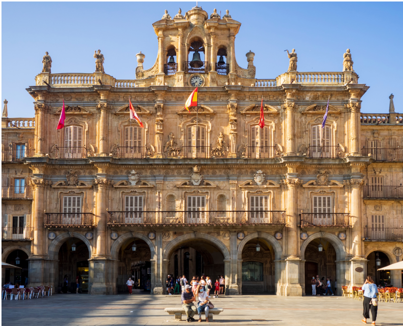
Ayuntamiento de Salamanca.

No todas las provincias cuentan con una diputación provincial. Ni las CCAA uniprovinciales, ni las islas tienen diputaciones provinciales. En el País Vasco existen Diputaciones Forales. El Gobierno cuenta con órganos periféricos en los distintos territorios para dirigir la Administración del Estado. En cada CCAA hay una Delegación del Gobierno y en cada provincia hay una Subdelegación del Gobierno.