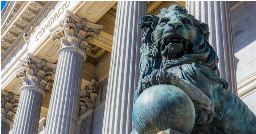
Detalle de la fachada del Congreso de los Diputados, Madrid.