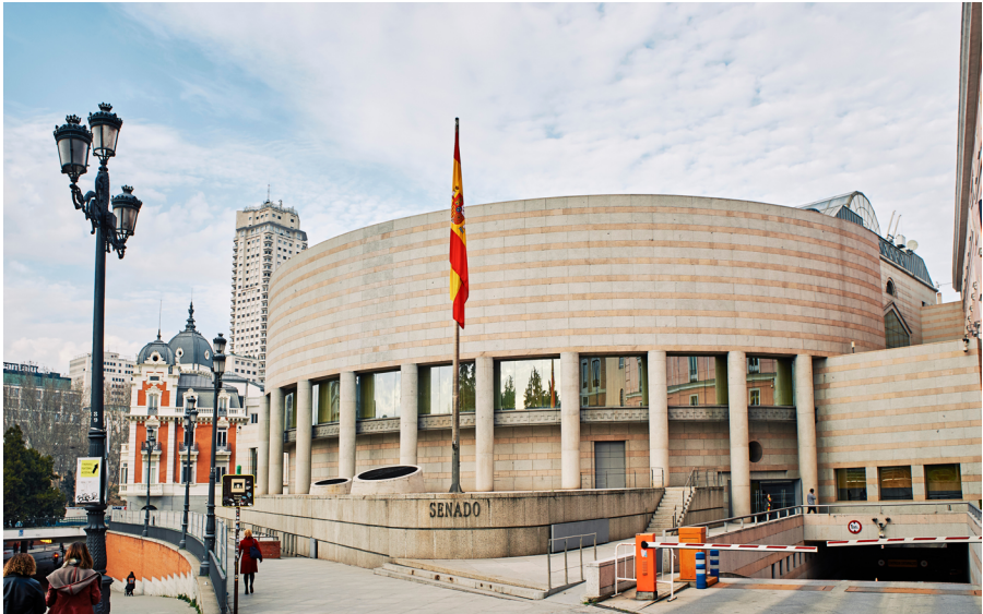
Edificio del Senado, Madrid.

El mandato de un legislador, diputado o senador, dura como máximo cuatro años . Transcurridos cuatro años, se vuelven a convocar elecciones, pero en muchas ocasiones las elecciones se celebran de forma adelantada, antes de que se agoten los cuatro años. El Presidente de gobierno puede disolver las Cortes y convocar nuevas elecciones en cualquier momento . Además, en nuestro país los diputados y los senadores pueden presentarse a la reelección tantas veces como quieran, no hay limitación en el número de mandatos.